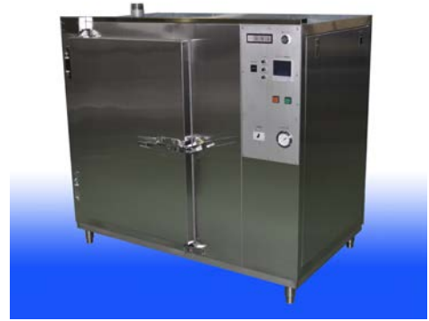
ボックスフリーザー BF-350