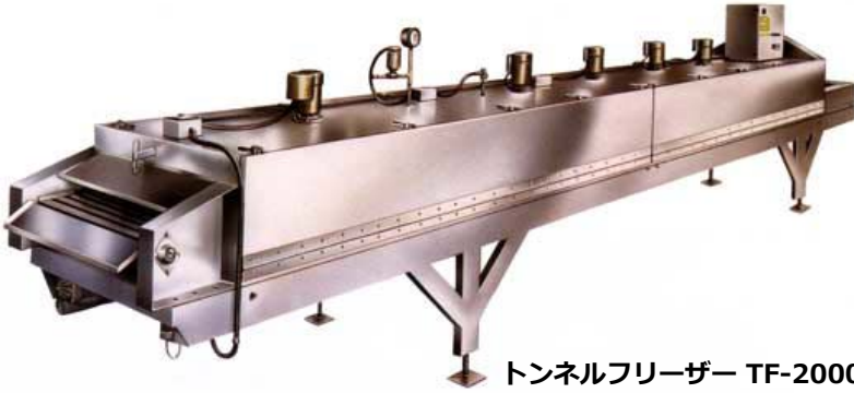
トンネルフリーザー TF-2000