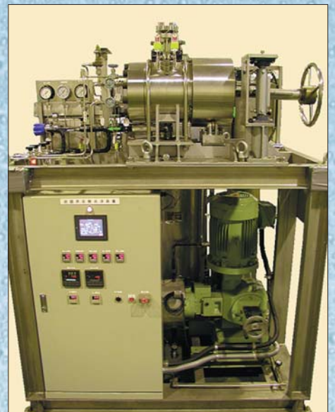
超臨界炭酸ガス洗浄／回収装置

超臨界炭酸利用技術は、有機溶剤不使用による労働環境改善をはじめ、排水処理不要、乾燥工程不要、非引火性かつ無害な、環境調和型の新しい装置を提供します。